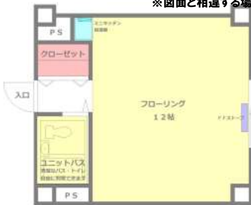
A館102号室平面図 (反転タイプあり) ※A館男性専用 (一部女性専用フロアあり)